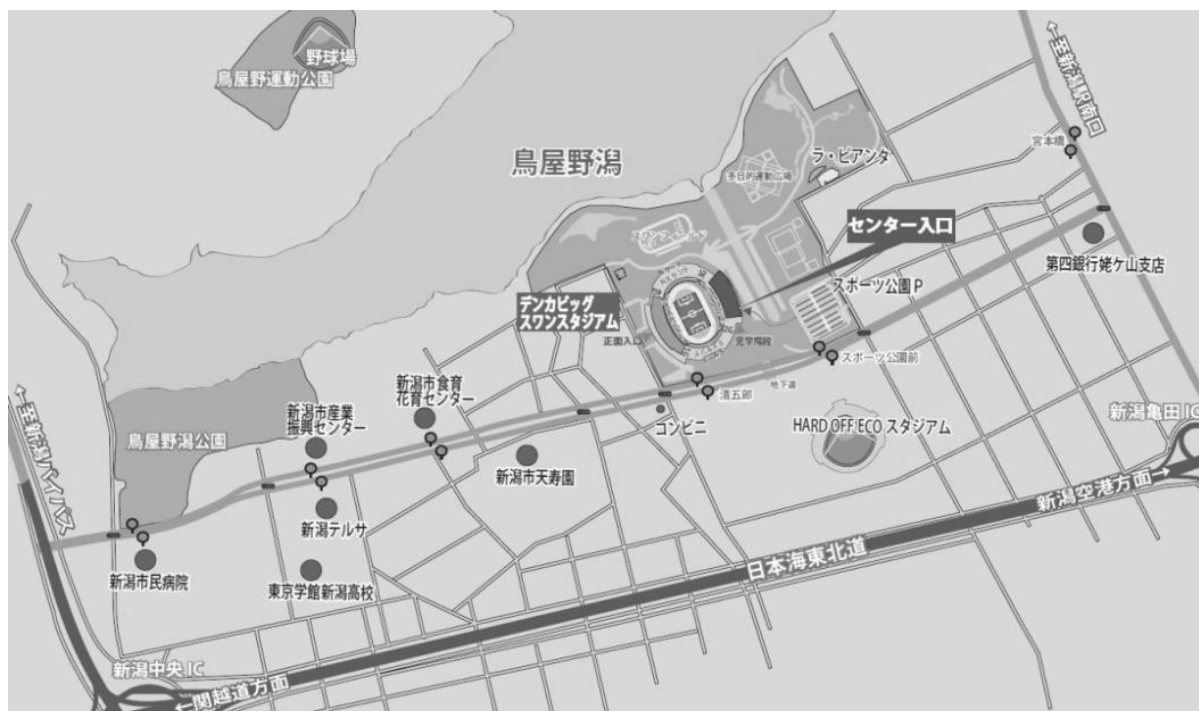
高速道路「日本海東北道」新潟中央 IC からセンターまでの地図

下の「地図」をご覧ください、「新潟県スポーツ公園駐車場P1（無料）」をご利用ください。