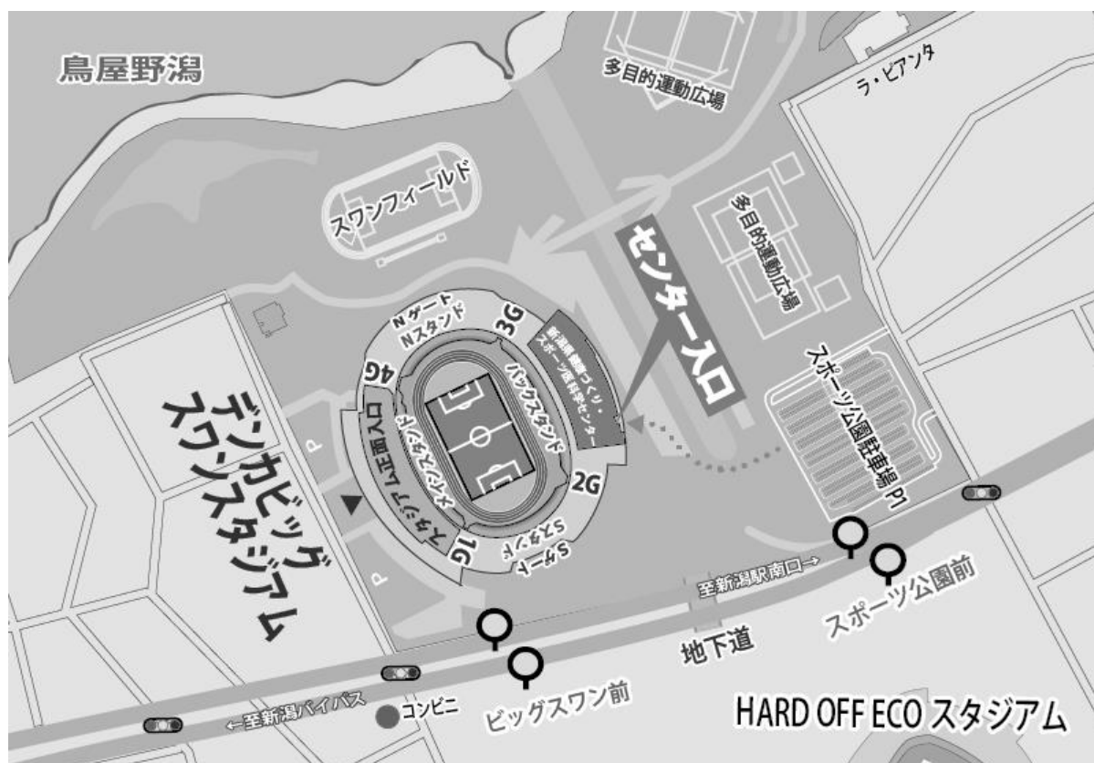
センター周辺の地図